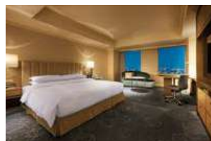
デラックスダブルルーム / Deluxe Double Room

Who would have thought such tranquility could be found at bustling Nagoya Station? With our warm and relaxing atmosphere, staying at Nagoya Marriott Associa Hotel makes you feel a lot like coming home. Enjoy your greatest moment can do nowhere but here.