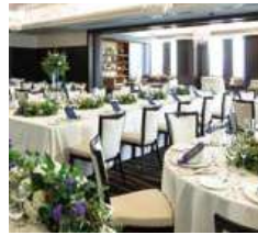
16・17F 中宴会場／ 5室(アイリス・アゼリア・サルビア・コスモス・ルピナス) 170～460m 2 16・17F 小宴会場／ 9室(楓・桂・桐・樺・バイン・オーク・アスター・スーペリアルーム) 53～100m 2 FUNCTION ROOMS: 14 rooms, 53 to 460 square meters: