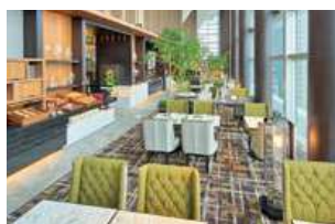
コンシェルジュラウンジ / Concierge Lounge

The Concierge Floors and Suite rooms offer premium service, including a private lounge that serves breakfast, coffee and tea in the daytime as well as hors d'oeuvres and cocktails in the evening.