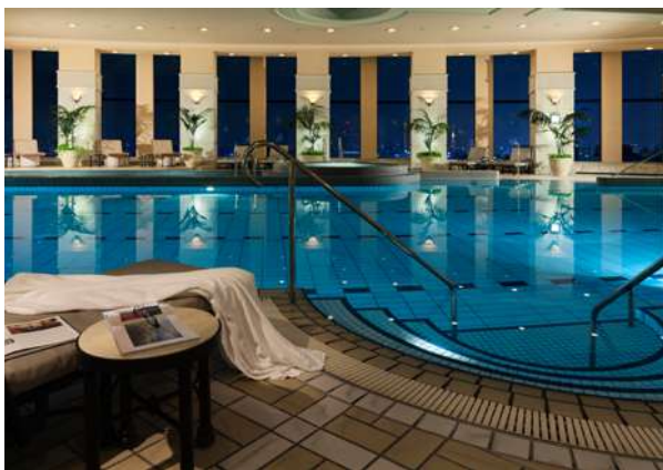
プール(20m×4コース)／Swimming Pool(20 meters long with 4 lanes)

The hotel also provides medium-sized rooms for wedding receptions and other functions, and smaller rooms for private functions. Each room is designed with its own unique look and atmosphere.