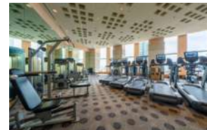
ジム・エアロビクススタジオ／ Fitness Gym & Exercise Studio