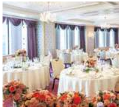
51F スカイバンケット／ 3室(ジュピター・シリウス・マーキュリー) 110～215m 2 SKY BANQUET ROOMS: 3 rooms 110 to 215 square meters: