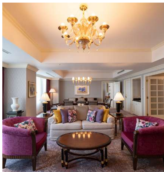
マリOTTスイート / Marriott Suite

Since our founding in 1927 by J. W. Marriott, Marriott Hotels have been the choice of innumerable guests in countries all around the world. Nagoya Marriott Associa Hotel now welcomes a new generation of travelers in that same spirit of hospitality.