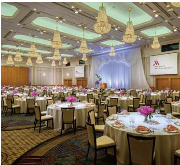
16F タワーズボールルーム／1,200m 2 均等 3分割可 TOWERS BALLROOM: 1,200 square meters (divisible into three parts):