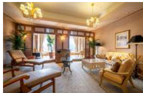
リラクゼーションルーム／ Relaxation Room

全長20メートルの室内プールに加え、多様なトレーニングマシンを完備。 地上18階のスカイリゾートで、優雅なひとときをお過ごしください。 Facilities include a 20-meter indoor swimming pool and a range of exercise equipment. Work out in style at this 18th-floor sky resort.